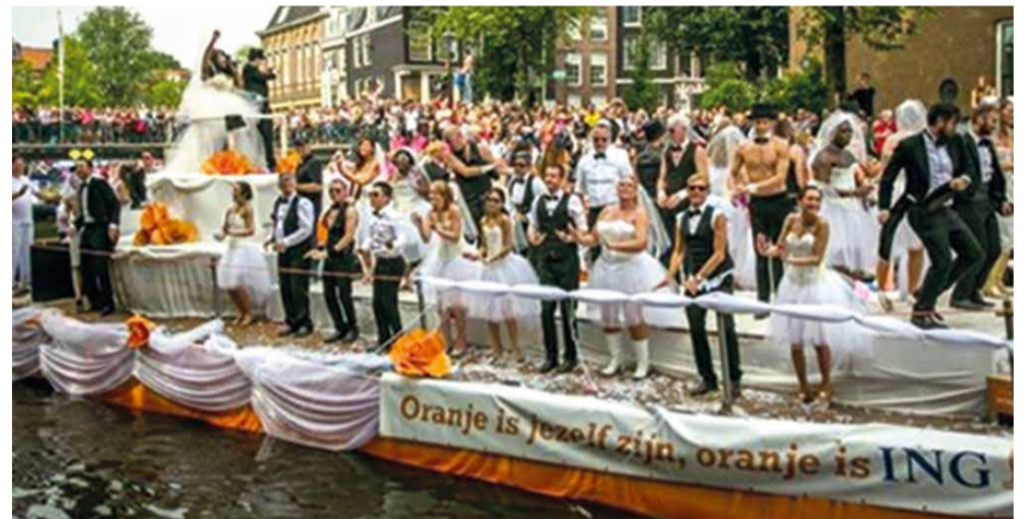
De 'huwelijksboot' van ING (2015)

beter zichtbaar wordt. Op dit moment wordt de collectie geïnventariseerd en beschreven. Daarnaast zijn er plannen om tijdens World Pride in 2026 de geschiedenis van het Rainbow Lions netwerk te vieren met een tentoonstelling.