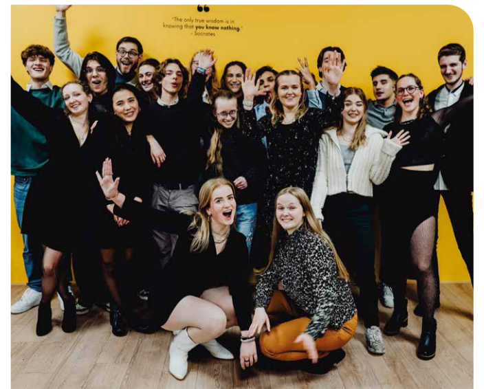
De jongeren van Powerjaar maken kennis met diverse bedrijven.